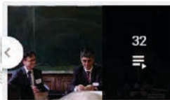
32 IREDIES - The Global Pact for the Environment