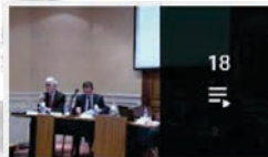
18 IREDIES - Droit international de la mer