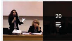
20 IREDIES - Regards croisés universitaires et syndicaux sur...