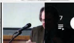
7 IREDIES - Les entretiens de la défense européenne - 2e éditio...