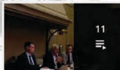
11 IREDIES - La diffamation saisie par les juges en Europe