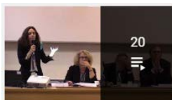
20 IREDIES - Regards croisés universitaires et syndicaux sur...