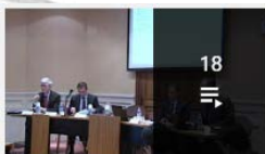
18 IREDIES - Droit international de la mer