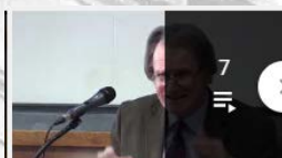
7 IREDIES - Les entretiens de la défense européenne - 2e éditio...