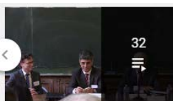
32 IREDIES - The Global Pact for the Environment