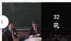
IREDIÉS - The Global Pact for the Environment