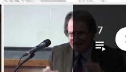
IREDIÉS - Les entretiens de la défense européenne - 2e éditio...