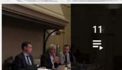
IREDIÉS - La diffamation saisie par les juges en Europe