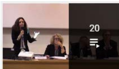
IREDIÉS - Regards croisés universitaires et syndicaux sur...